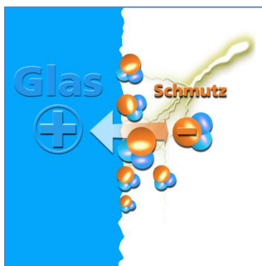
Schmutz wie beispielsweise Kalk kann Verätzungen auf der Oberfläche verursachen – die dauerhafte Barriere "Glas auf Glas" reduziert das Anlagern von Verschmutzungen.