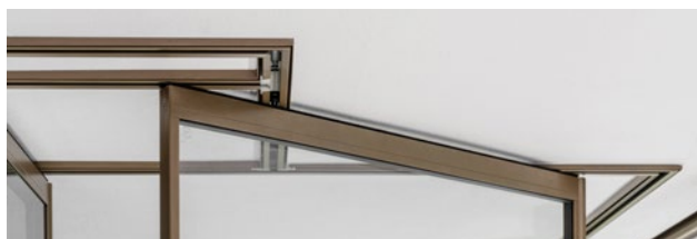
Bahnhof integriert in Decke