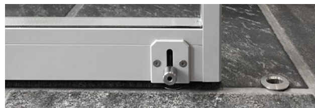
Steckriegel mit Bodenhülse