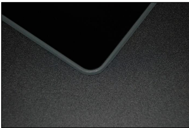
flächenbündiger Einbau von Kochfeld