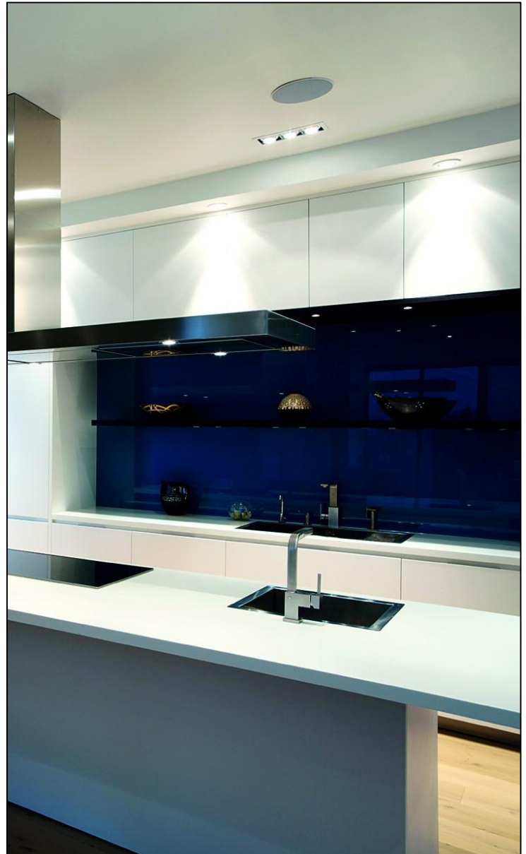
Küchenrückwand RAL 5003 (Saphirblau) lackiert

Die sehr breite Anzahl an unterschiedlichen Farben (RAL- und NCS-Farbtönen) sowie auch der hochauflösende Photoprint erfüllen jeden auch noch so spezifischen Kundenwunsch. Dank der Verwendung von umweltfreundlichem Wasserlack ohne Lösungsmittel erfüllen wir bei lackierten Gläsern den «Minergie A Eco»-Standard.