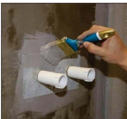
Beispiel zur Abdichtung der Armaturen